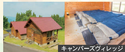
キャンパーズヴィレッジ

氷ノ山のパノラマビューと満天の星空が広 がる天空のキャンプ場。広々としたオートサ イトは大型車やペット同伴もOK。手ぶら プランやWi-Fi、温水シャワー完備で、初 心者から上級者まで快適に自然を満喫 できます。