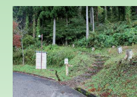
9 氷ノ越コース登山口