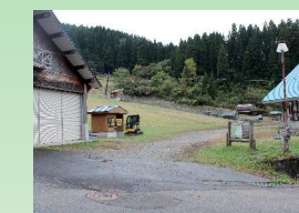
12 三ノ丸コース登山口