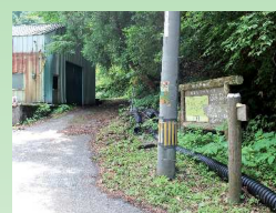
10 仙谷コース登山口