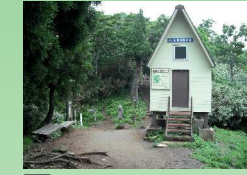
2 氷ノ越 避難小屋