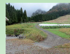
11 仙谷コース登山口